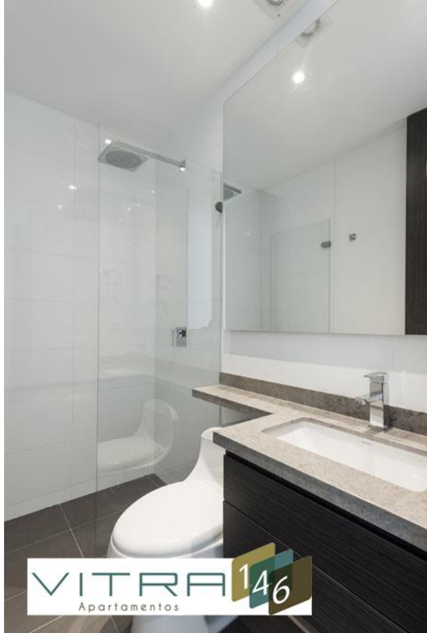
BAÑO HABITACIÓN 2