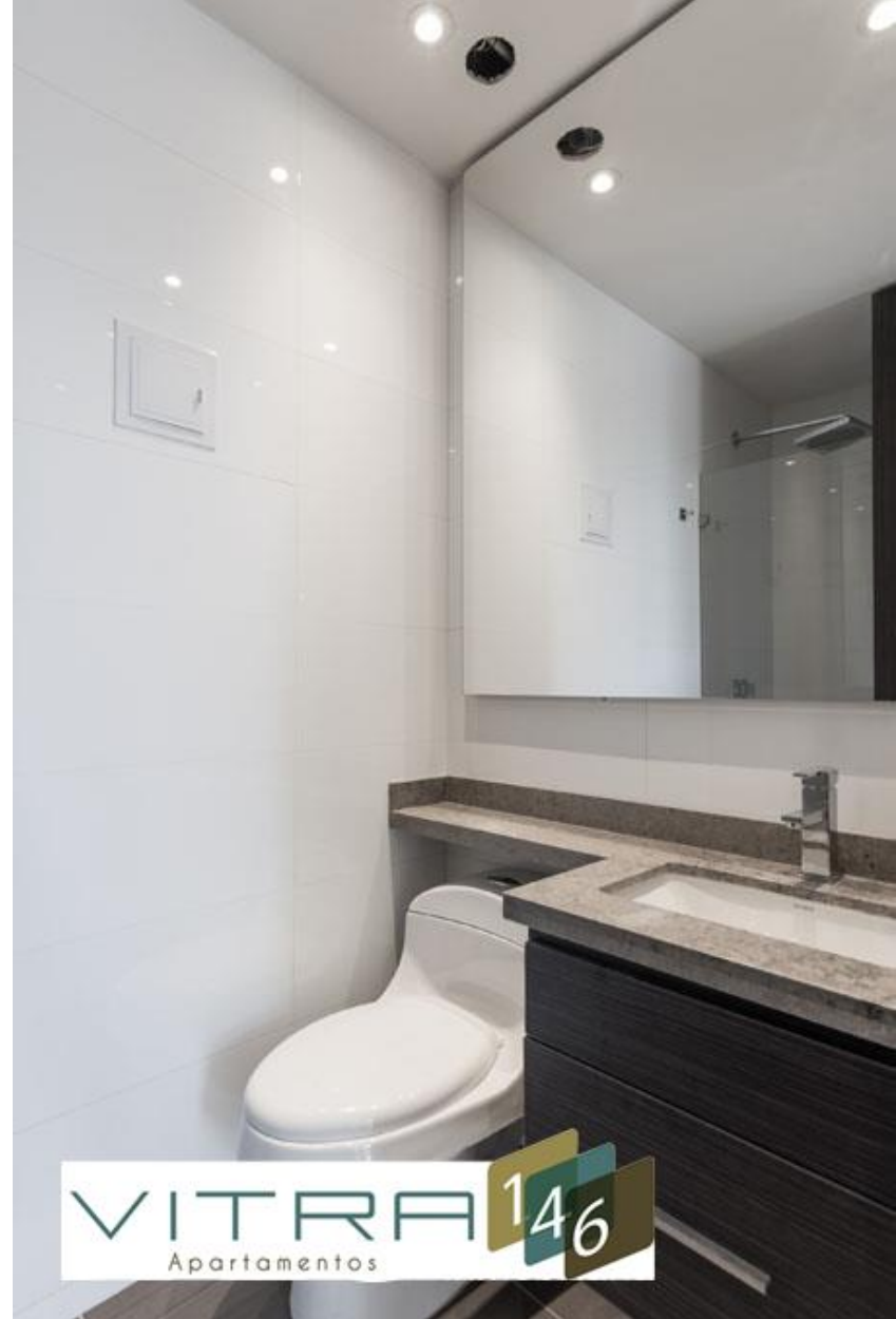
BAÑO HABITACIÓN PRINCIPAL