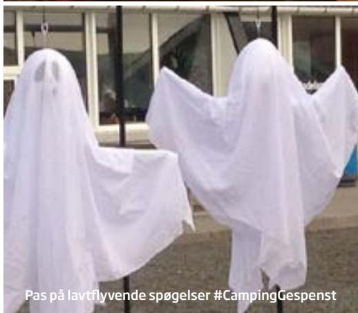
Pas på lavtflyvende spøgelser #CampingGespenst