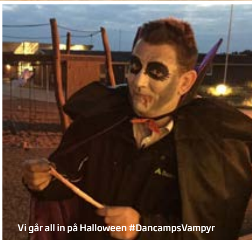
Vi går all in på Halloween #DancampsVampyr