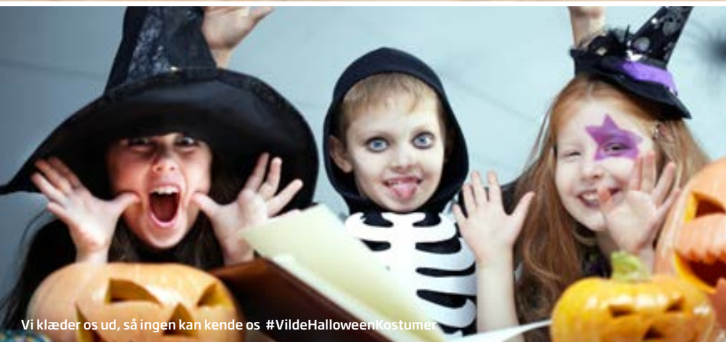
Vi klæder os ud, så ingen kan kende os #VildeHalloweenKostumer