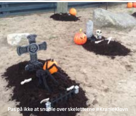
Pas på ikke at snuble over skeletterne #KranieKlovn