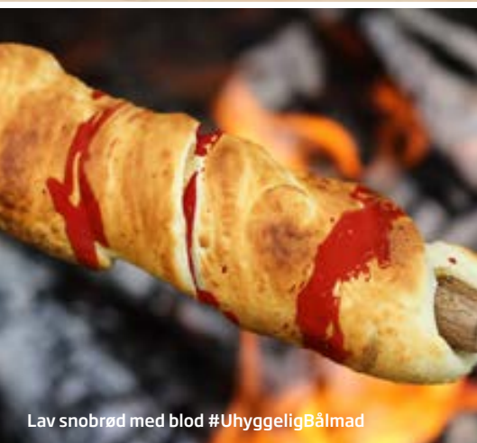
Lav snobrød med blod #UhyggeligBålmaid