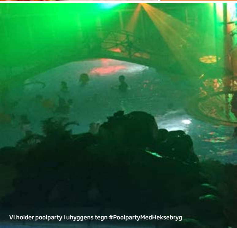
Vi holder poolparty i uhyggens tegn #PoolpartyMedHeksebyg

Hvem siger, at pizzaer kun skal være sådan nogle kedelige nogen med ost og skinke? Monstre spiser for eksempel pizza med både spindelvæv, edderkopper og med et drys af spøgelseskrimmel og troldesnot. Kan du lave en lige så uhyggeligt lækker pizza?