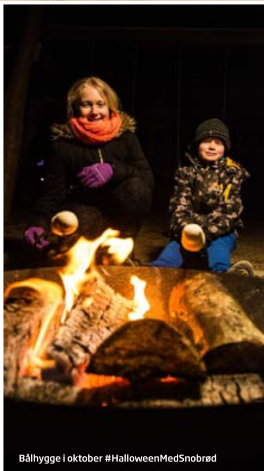
Bålhygge i oktober #HalloweenMedSnoabrød