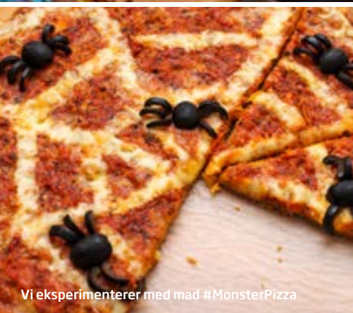
Vi eksperimenterer med mad #MonsterPizza