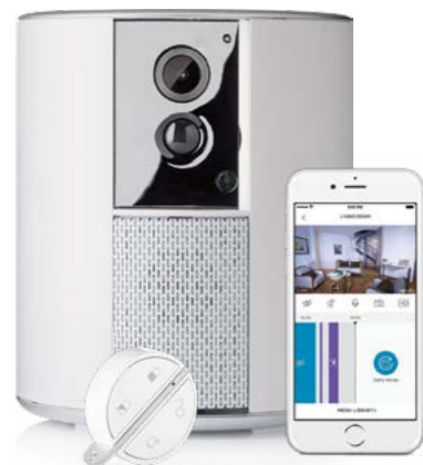
Caméra Somfy One+

Les services d'AXA Assistance pour vous accompagner en cas de sinistre : aide aux démarches administratives, et 4 heures de ménage (24) .