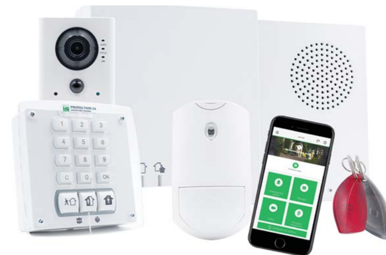
Matériel de télésurveillance Protection 24

Votre abonnement Protection 24 à partir de 32,70 € / mois + 145 € de frais d'installation, -50 % sur la garantie «Vol et Vandalisme au domicile» et aucune franchise en cas de vol.