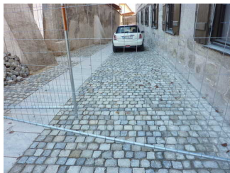
Parkfläche für Menschen mit Behinderung