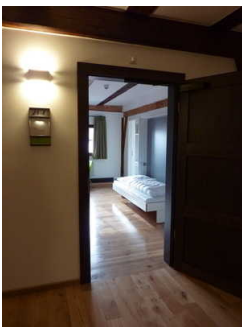
Zimmertür Zimmer 207