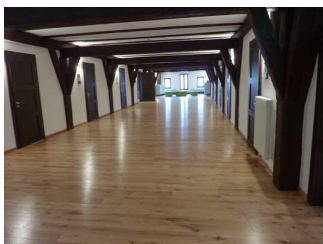
Flur im 1. und 2. OG