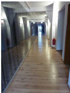
Flur im 3. OG