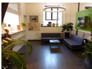
Rezeption mit Sitzgelegenheit