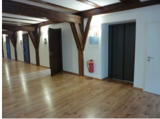
Weg vom Aufzug zum Zimmer