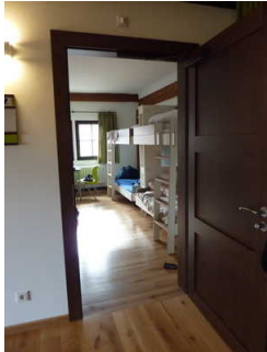
Zimmertür Zimmer 112