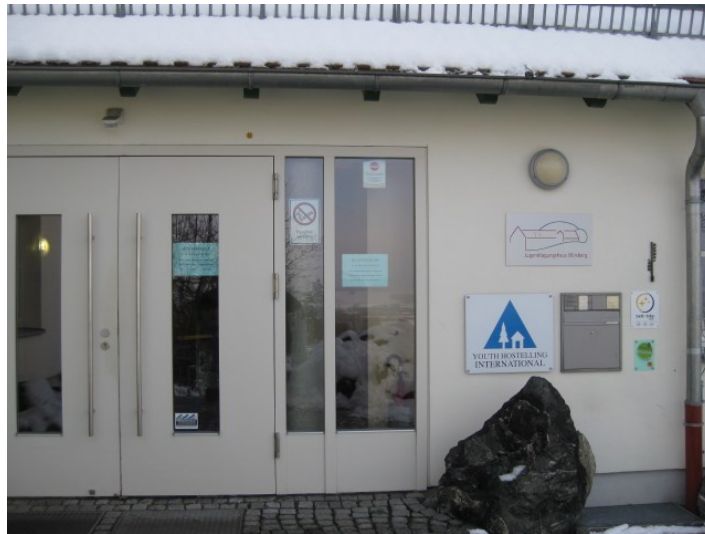
Eingangsbereich der Jugendherberge Wirsberg