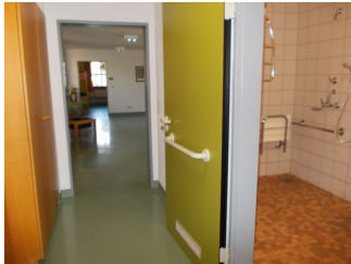
Flur bzw. Eingang zu Sanitärraum in Zimmer 130