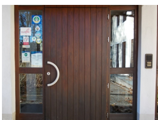
Eingang Jugendherberge; Informationen links auf Scheibe befestigt, Klingel rechts