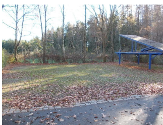
Weiterer Parkplatz Nähe Eingangsbereich