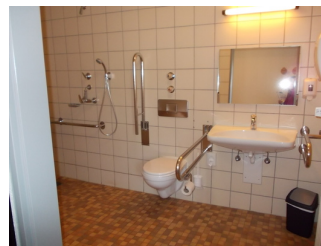
Sanitärraum im Zimmer 127