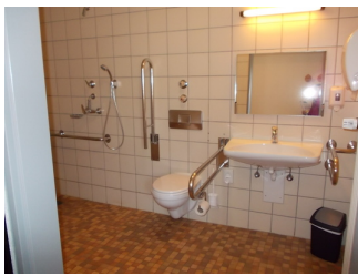
Spiegel im Sitzen und Stehen einsehbar