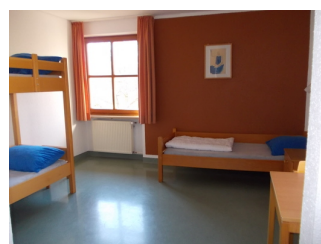
Zimmer für Menschen mit Behinderung und Betreuer