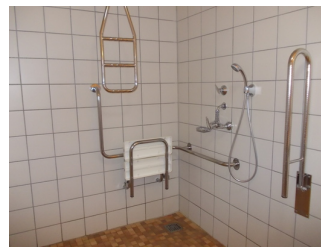
Duschbereich im Zimmer 130