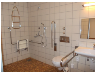
Sanitärraum im Zimmer 127