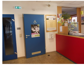
Rezeption bzw. Tür zu Toilette für Menschen mit Behinderung