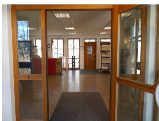
Sicht auf Rezeption von Eingang