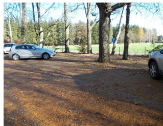
Parkplätze für Menschen mit Behinderung