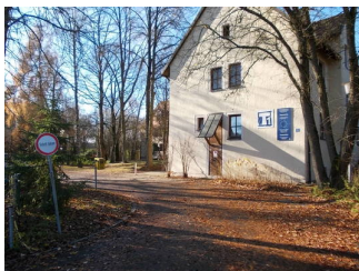
Beschriftung deutlich von Straße aus erkennbar