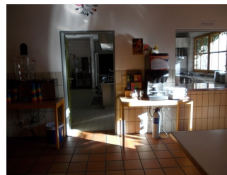
Sicht von Speiseraum in Küche bzw. Essenausgabe