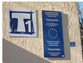
Beschriftung an JH Falkenberg- Tannenlohe

Informationen, die der Orientierung dienen und aus Wörtern bestehen, sind vorhanden.