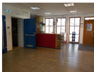
Sicht auf Rezeption