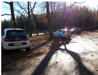
Parkplatz für Menschen mit Behinderung