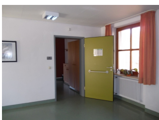
Eingangstüre zu Zimmer 130 für Menschen mit Behinderung