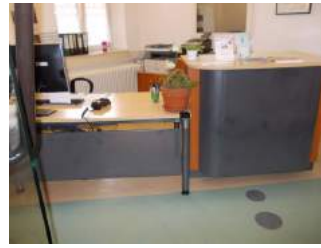
Weg in Rezeption zum Tresen