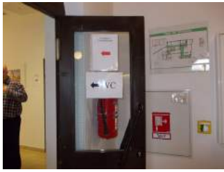
Etagenbad und WC