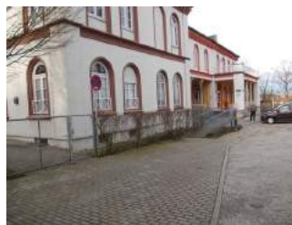
Weg von Parkplatz zu Rampe