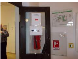
Wegweisung in JH