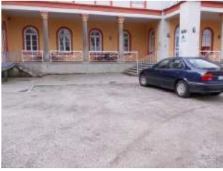
Weg zu Haupteingang rechts