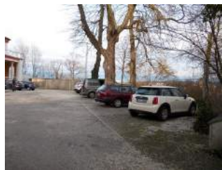
Parkplatz im Hof