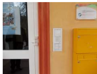
Klingel JH und Briefkasten