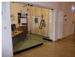
Weg zur Rezeption