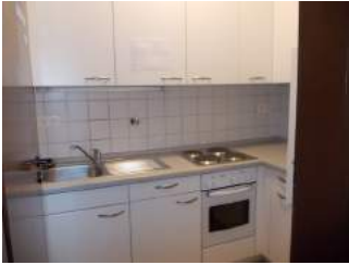
Teeküche in Apartment 123a und 123b