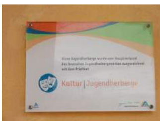
Beschilderung Eingang JH

Informationen, die der Orientierung dienen und aus Wörtern bestehen, sind vorhanden.