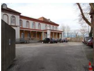
Parkplatz und Wege zum Eingang