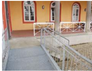
Weg von Rampe zu Haupteingang