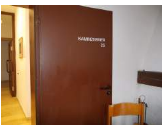
Weg Eingang zu Tagungsraum

unterbrechungsfreies Wegeleitsystem Wegezeichen in sichtbarem Abstand