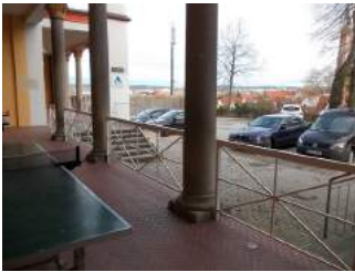
Weg zum Haupteingang