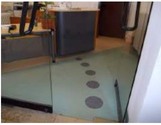
Weg in Rezeption zum Tresen