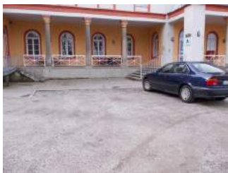
Parkplätze vor der Eingang