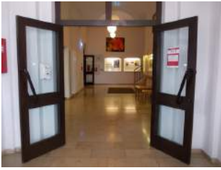
Weg zu Speiseraum nach Durchgang rechts