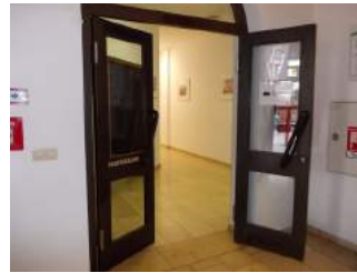
Weg Eingang zu Tagungsraum