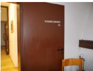
Eingangstür zum Kaminzimmer