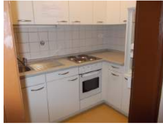
Teeküche in Apartment 123a und 123b