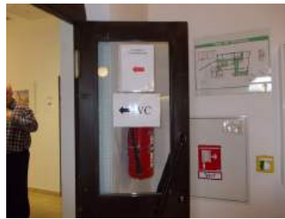
Weg zu Zimmer 25