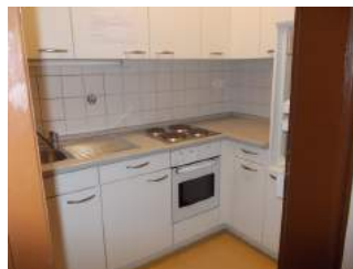
Teeküche in Apartment 123a und 123b