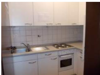
Teeküche in Apartment 123a und 123b