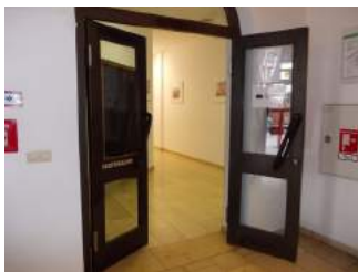
Weg zum Etagenbad