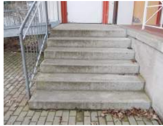
Treppe zu Eingangsbereich