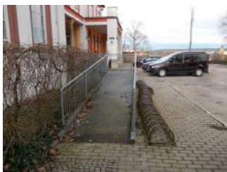
Rampenauffahrt zum Haupteingang