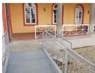
Weg von Rampe zu Haupteingang