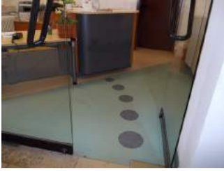
Weg in Rezeption zum Tresen