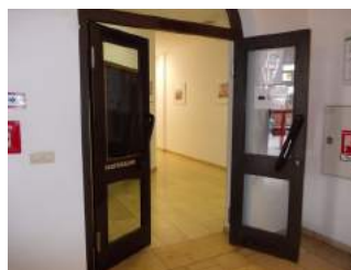
Weg Eingang zu Tagungsraum