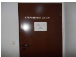
Tür zu Apartment 123a und 123b