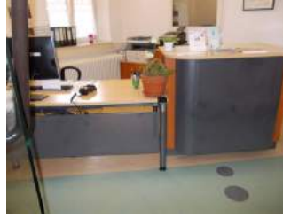
Weg in Rezeption zum Tresen