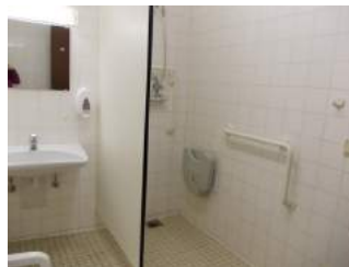
Duschbereich für Menschen mit Behinderung