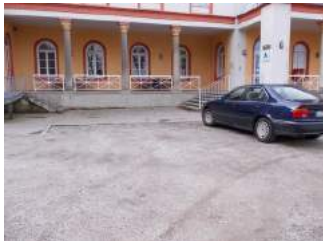
Parkplätze vor der Eingang