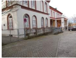
Weg von Parkplatz zu Rampe