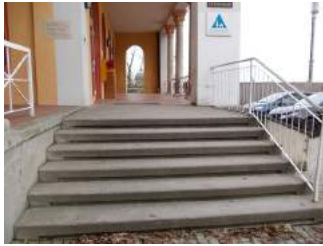
Treppe zum Eingangsbereich