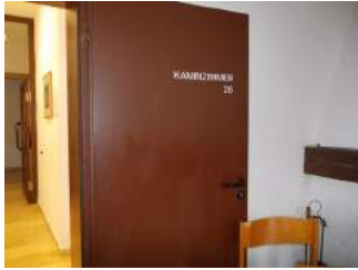
Eingangstür zum Kaminzimmer