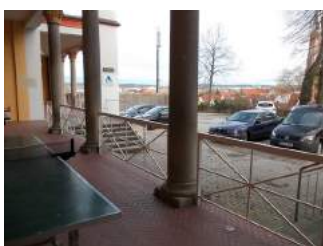
Weg zum Haupteingang