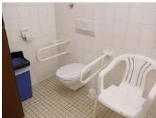
Etagenbad = WC für Menschen mit Behinderung