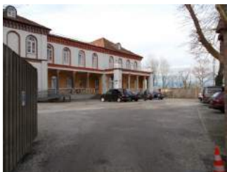
Parkplatz und Wege zum Eingang