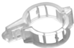
Anillos de Tutoreo