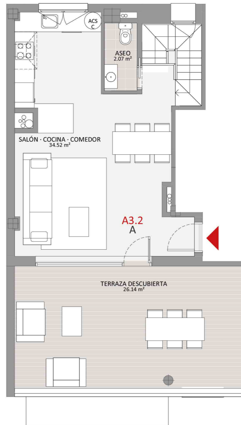
ESCALERA 2 - PLANTA ÁTICO