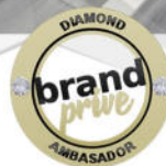
Mercedes Clase C