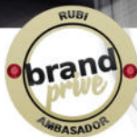
Mercedes Clase A

*Información actualizada y ampliada en brandprive.es Consultar detalles y condiciones de calificación.