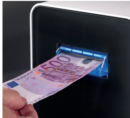
Acepta y verifica todos los billetes, incluyendo el de 500 €