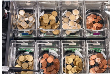
Cada moneda tiene su propio hopper Máxima fiabilidad y rapidez