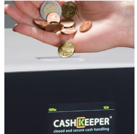
Acepta, valida, recicla y paga todas las monedas