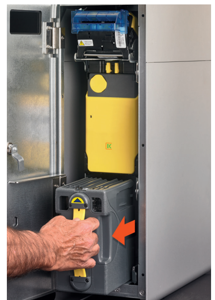
Recaudación de billetes en un módulo cerrado. Nadie ve ni toca el dinero