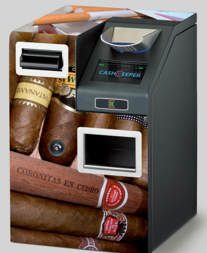
Imanes para soporte publicitario