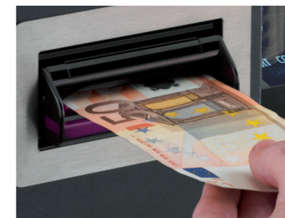
Todos los billetes aceptados son auténticos