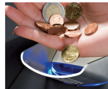
Acepta y verifica 4 monedas por segundo