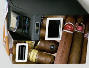
Imanes para soporte publicitario