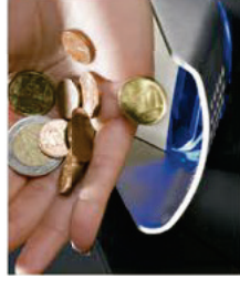
Acepta y verifica 4 monedas por segundo