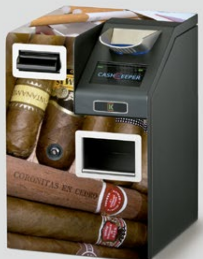
Imanes para soporte publicitario