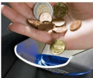
Acepta y verifica 4 monedas por segundo