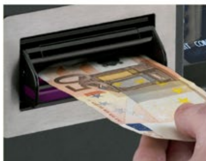
Todos los billetes aceptados son auténticos