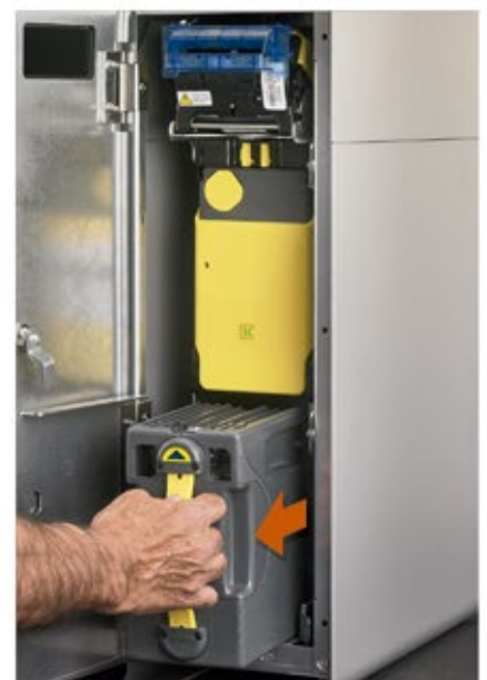
Recaudación de billetes en un módulo cerrado. Nadie ve ni toca el dinero

Sistema de validación de billetes de nueva generación. Validación ampliada a todo el ancho del billete. Las tecnologías actuales solamente validan la parte central del billete.