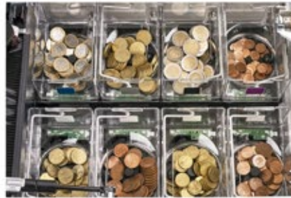
Cada moneda tiene su propio hopper. Máxima fiabilidad y rapidez