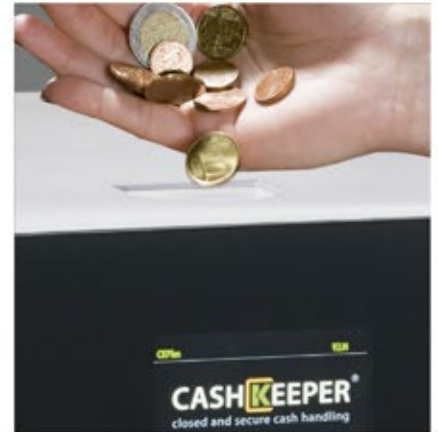
Acepta, valida, recicla y paga todas las monedas