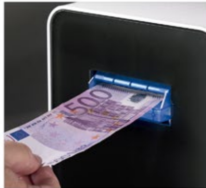
Acepta y verifica todos los billetes, incluyendo el de 500 €