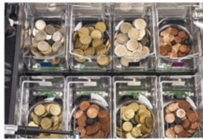
Cada moneda tiene su propio hopper Máxima fiabilidad y rapidez