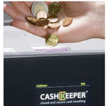
Acepta, valida, recicla y paga todas las monedas