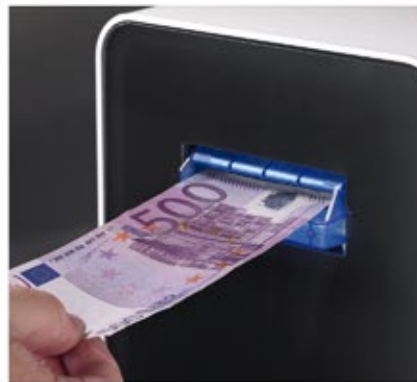
Acepta y verifica todos los billetes, incluyendo el de 500 €