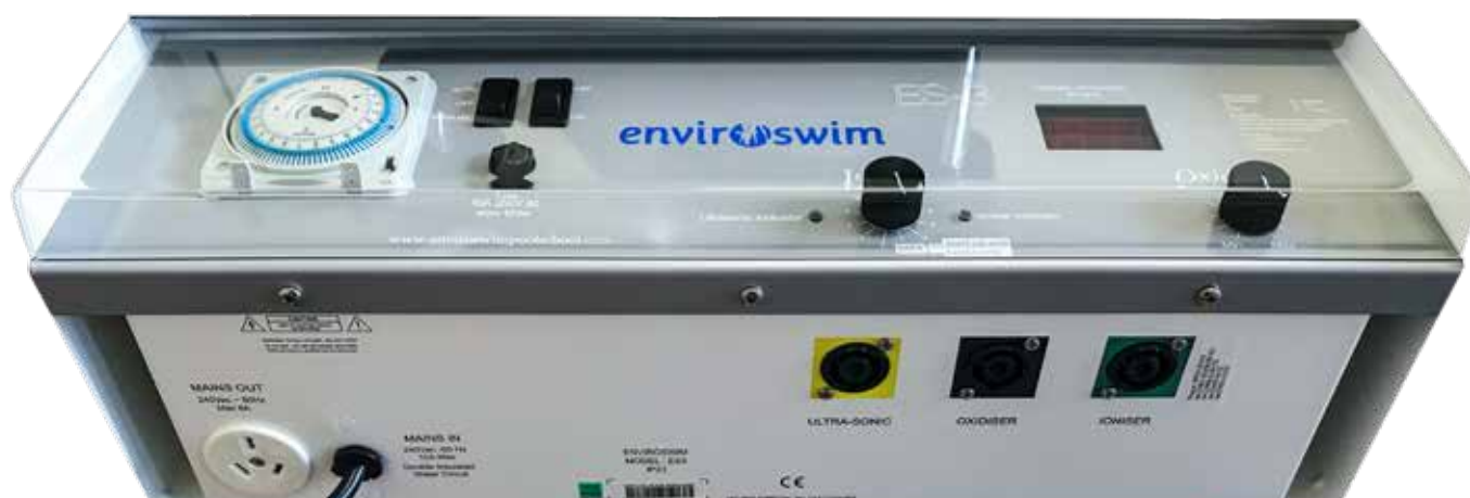
Unità Elettronica di Controllo