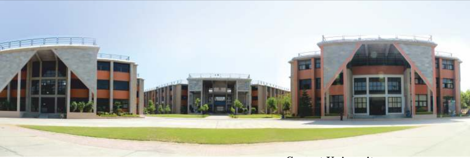
Ganpat University University of Facilities

ગણપત યુનિવર્સિટી ૨૦૦૫માં રાજ્ય વિધાનસભા અધિનિયમ ૧૯, ૨૦૦૫, ગુજરાત સરકાર તેમજ યુજીસી અધિનિયમ ૧૯૫૬ની કલમ ૨ (એફ) હેઠળ યુજીસી દ્વારા માન્યતા પ્રાપ્ત ૩૦૦થી વધુ એકર જગ્યામાં વર્લ્ડ ક્લાસ ઈન્ફ્રાસ્ટ્રક્ચર સાથે ફેલાયેલી પ્રખ્યાત યુનિવર્સિટી છે. જેમાં એન્જીનીયરીંગ અને ટેકનોલોજી, ફાર્મસી, મેનેજમેન્ટ, કમ્પ્યુટર એપ્લિકેશન્સ, સાયન્સ જેવા વિવિધ પ્રકારના અભ્યાસક્રમ સાથે સંકલિત કોલેજો પ્રસ્થાપિત છે. વિશ્વવ્યાપક દૃષ્ટિ સાથે યુનિવર્સિટીએ “શિક્ષણ દ્વારા સમાજનો વિકાસ” કરવાનું ઉત્કૃષ્ટ ઉદ્દેશ્ય પૂરું પાડ્યું છે.