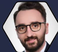
Ozal Hopi Styrelseledamot

Över 20 års erfarenhet av resemarknadsföring på bland annat British Airways, American Express och Amex Travel där han var vice VD för internationell varumärkesstrategi. Tidigare marknadschef på STA Travel.