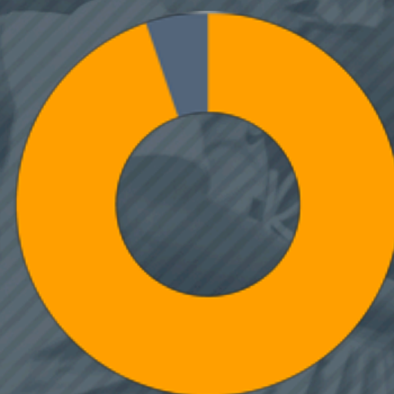
Bil i familjen

● 1 (6%) ● 2 (13%) ● 3 (15%) ● 4 (46%) ● 5 (20%)