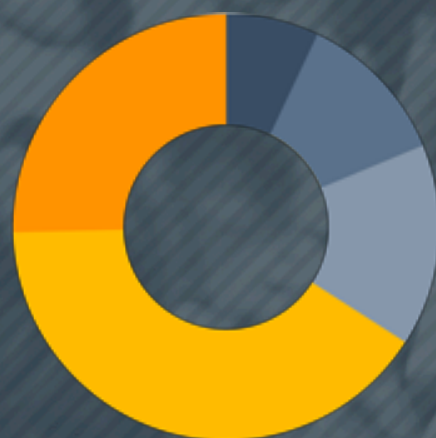
Personer i hushållet

● 1 (6%) ● 2 (13%) ● 3 (15%) ● 4 (46%) ● 5 (20%)