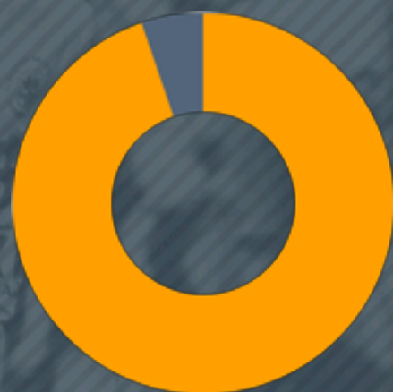
Boende i villa