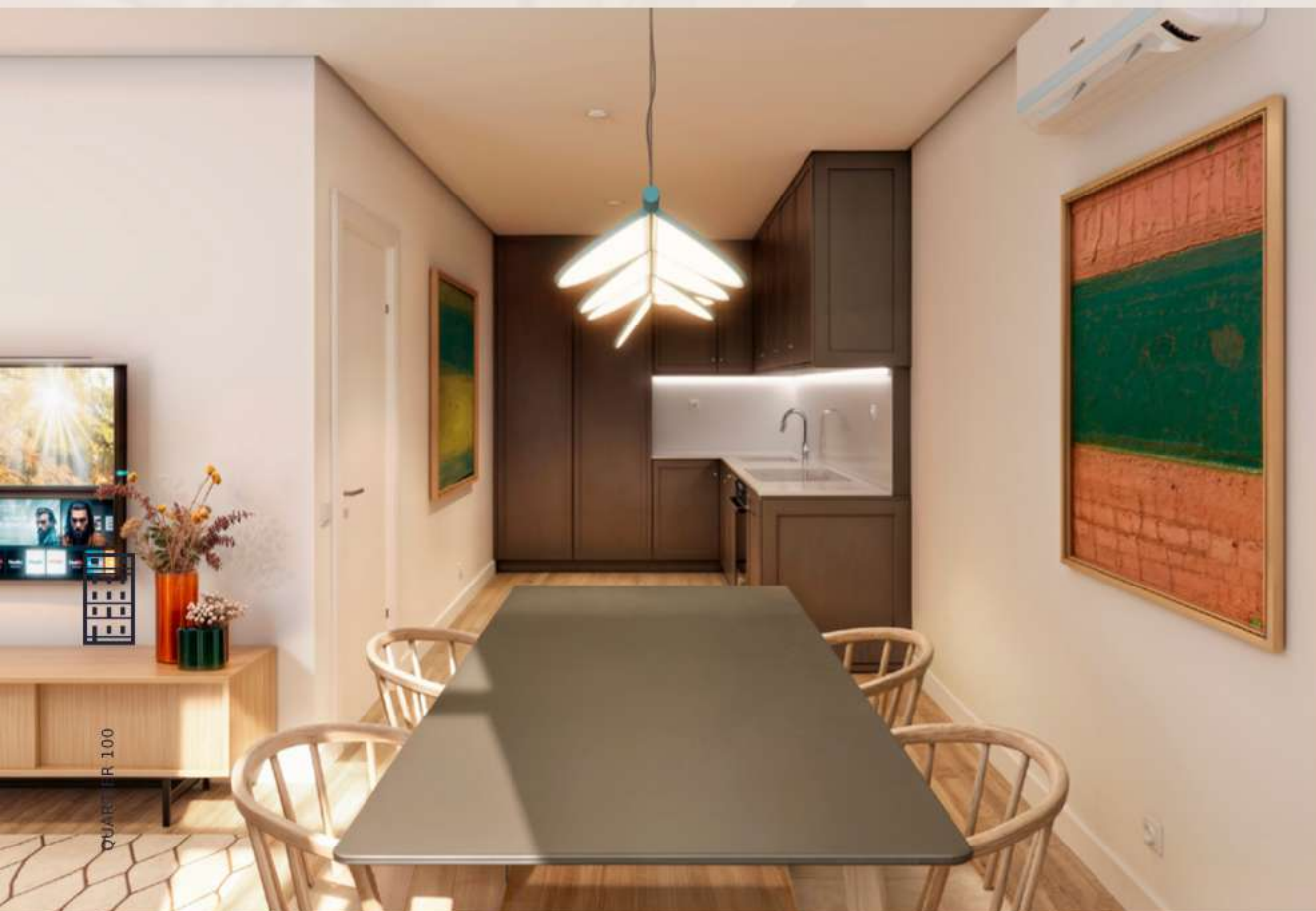
Piso 1, Apartamento T2, Sala e Cozinha