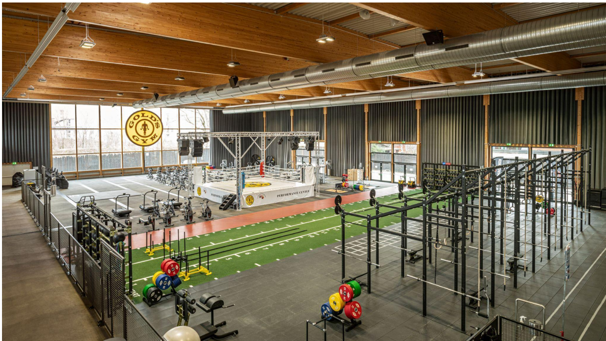
Foto: Das Gold Gym Performance Center in Berlin

Berlin, 05. Oktober 2023. Das Gold's Gym Berlin kooperiert ab sofort mit der Sport- und Wellnessplattform Urban Sports Club. Damit folgt die traditionsreiche Studiokette weiteren beliebten Studios der RSG Group in Berlin, bei denen Urban Sports Club-Mitglieder entsprechend ihrer Mitgliedschaft trainieren können.