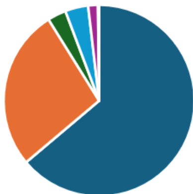
Tipo de Estudios