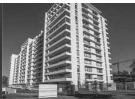
Edificio Ossa Mayor