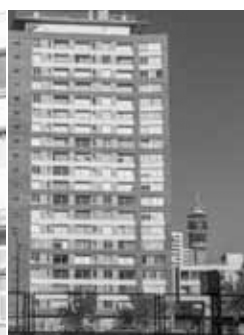
Edificio Vanguardia Moneda