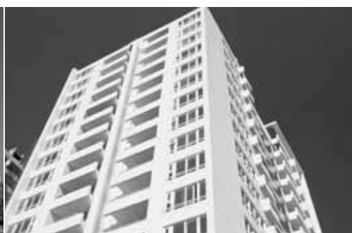
Edificio Aires del Llano