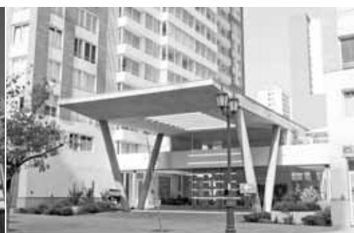
Edificio Alto Plaza Bulnes