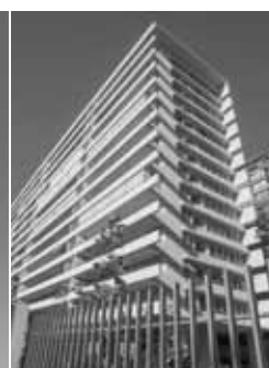
Edificio Bello Horizonte II