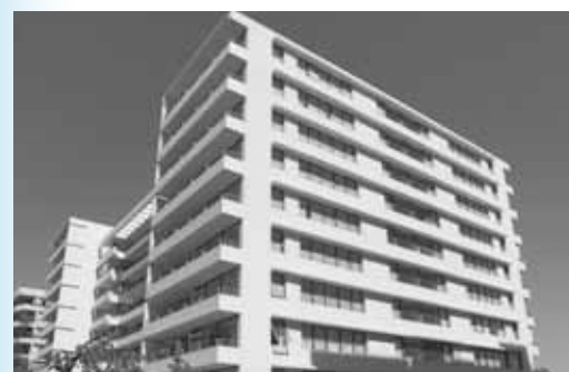
Edificio Bello Horizonte

Hoy, la Compañía cuenta con un equipo de profesionales y una plataforma de gestión inmobiliaria adaptada para emprender proyectos en diversos segmentos de mercado, tanto en Chile como en el exterior, extendiendo sus operaciones a Lima, abriendo formalmente durante 2014 sus oficinas como filial inmobiliaria en Perú.